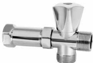
3019 - Razvodnik za veš mašinu i slavinu TH