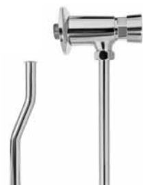
3001 - Potisna slavina za pisoar okrugla