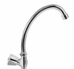
8005 - Slavina za hladnu vodu STH, keramička virbla