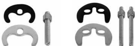
Fiksator za slavine sa 1 šrafom Fiksator za slavine sa 2 šrafa