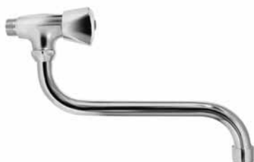
S 8009 - Slavina za hladnu vodu, donji izliv, keramička virbla