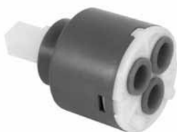
Mešač f 35