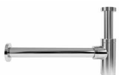
A 182 - Sifon za lavabo - lux