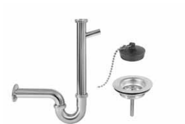
S 03 - Sifon za sudoperu 6/4 pvm