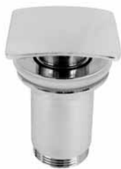
F47-C - Podsklop automatski 5/4 četvrtasti