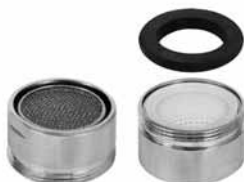
Perlator M 24X1 Perlator M 28X1