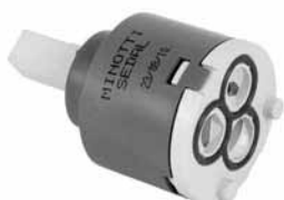
Mešač f 40 Mešač f 40 dvostepeni