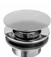
A 106 - Podsklop automatski 6/4 za tuš kadu