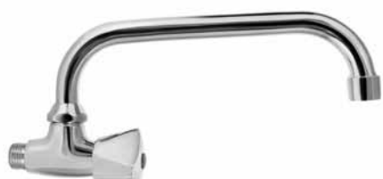
U 8009 - Slavina za hladnu vodu, gornji izliv, keramička virbla