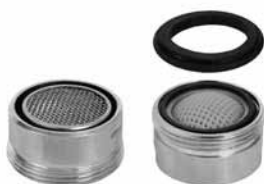
F 22 - Perlator