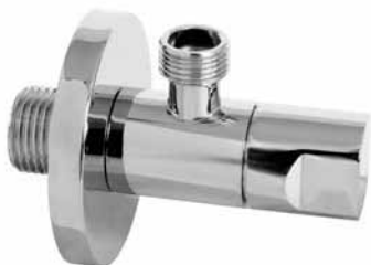
F01 - Ek ventil LUX okrugli 1/2x3/8