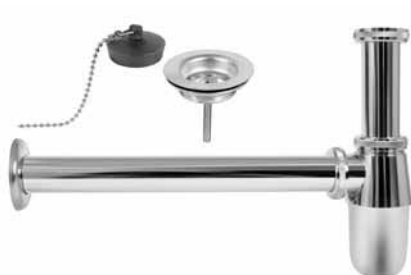
A 181-AC - Sifon za lavabo 5/4 sa piletom