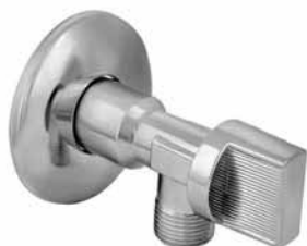
3003 - Ek ventil kugla 1/2x3/8