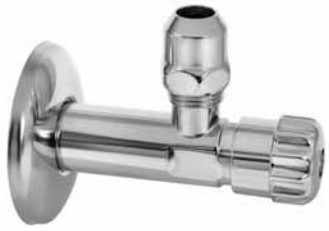
3049 - Ek ventil sa virblom 1/2x3/8 3049 - EK ventil sa virblom 1/2x1/2