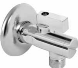
3001 - Ek ventil sa sitom 1/2x3/8