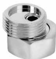
CF 6110 - 3/4 Navrtka ekscentrična za slavinu