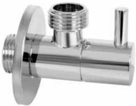
MINI F04 - Ek ventil MINI LUX okrugli 1/2x3/8 MINI F04 - Ek ventil MINI LUX okrugli 1/2x1/2