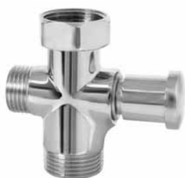
3048 - Prebacivač za švedsku slavinu