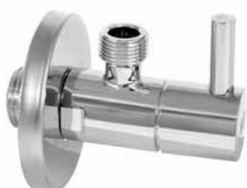
F04 - Rk ventil LUX okrugli 1/2 x 3/8