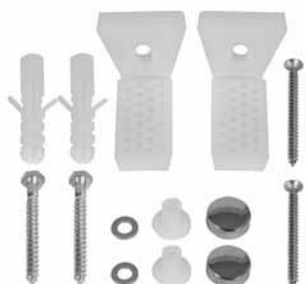
"L" profil za ugradnju monobloka Diana