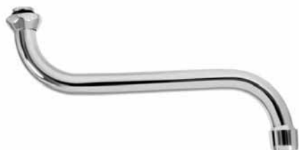
L 9922 - Lula donji izliv, hladna voda