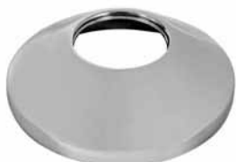
Rozetna za slavine 3/4