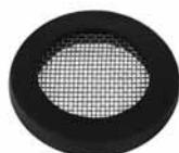
Gumica sa mrežicom