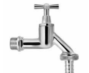
905212 - Baštenska slavina - leptir 1/2 hrom