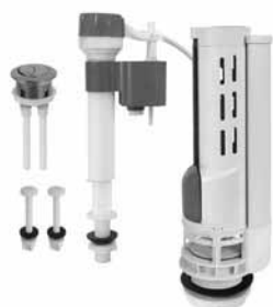
Mehanizmi za monoblokove (Quadro, Diana, Classic, Eko)