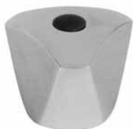
78 Ručica metalna