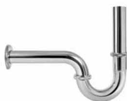
A 126-C - Sifon za bide