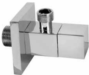
F05 - Ek ventil LUX četvrtasti 1/2x3/8