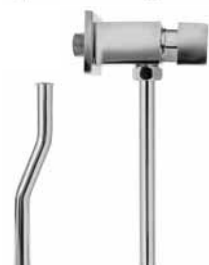
3007 - Potisna slavina za pisoar četvrtasta