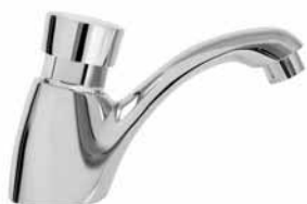
1001 - Potisna slavina za hladnu vodu