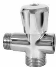
3022 - Krst ventil 1/2x3/4