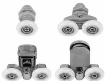
Točkíci za tuš kabine