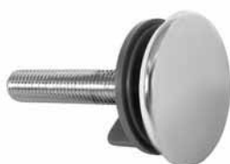
8016 - Čep za lavabo f50 HROM