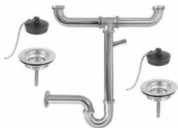
S 04 - Sifon za sudoperu dvodelni 6/4 pvm