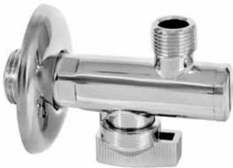
3002 - Ek ventil sa filterom 1/2 x 3/8