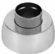
Rozetna šteljuća za slavine