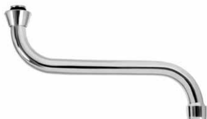
Lula za protočni bojler