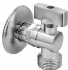
3016 - Priključak za veš mašinu