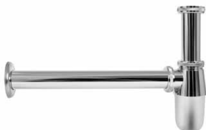
A 181 -A - Sifon za lavabo 5/4 bez pilete