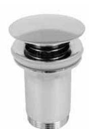
F 47 - Podsklop automatski 5/4 okrugli