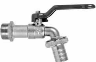
2004 - Baštenska slavina - kugla 1/2x3/4