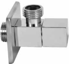
MINI F05 - Ek ventil MINI LUX četvrtasti 1/2x3/8 MINI F05 - Ek ventil MINI LUX četvrtasti 1/2x1/2