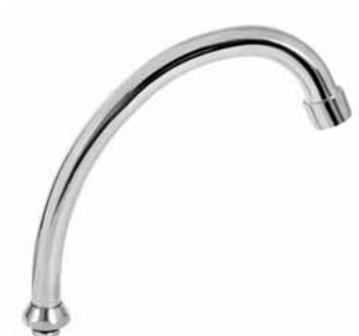
L 8005 - Lula gornji izliv, hladna voda